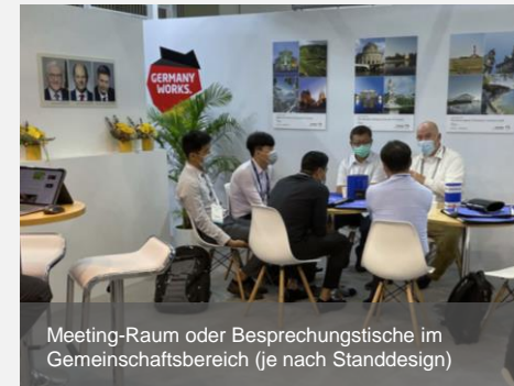
Meeting-Raum oder Besprechungstische im Gemeinschaftsbereich (je nach Standdesign)