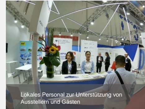
Lokales Personal zur Unterstützung von Ausstellern und Gästen