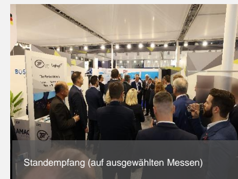
Standempfang (auf ausgewählten Messen)