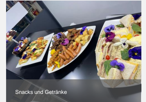
Snacks und Getränke