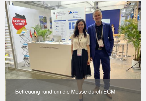
Betreuung rund um die Messe durch ECM